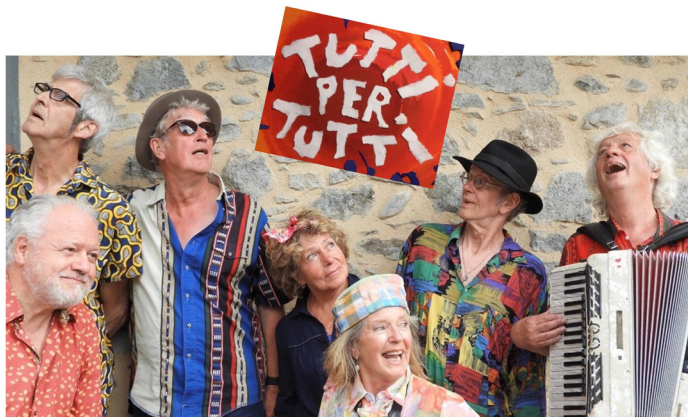
DE AMSTERDAMSE STRAATBAND

De sfeer van de Amsterdamse Straatband is altijd enthousiast en zeer gevarieerd en het spelplezier komt recht uit het hart. Ze voelen zich overal thuis. Zo ook deze middag in Zwanenburg.